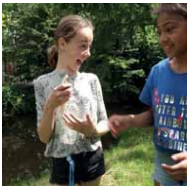
Het plezier spat van het gezicht