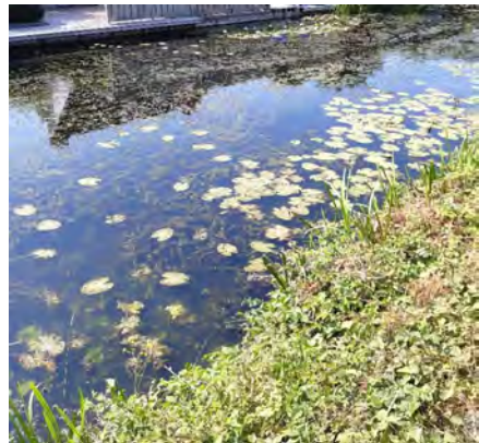
Dit was de situatie. Veel kroos en hoornblad.

In 2017 is een proef gestart met graskarpers in het water langs de Ooievaarslaan. Aanvankelijk verbeterde de situatie, echter er bleken te weinig graskarpers uitgezet te zijn. In 2019 zijn er nieuwe karpers bijgekomen en daarna werd de situatie veel beter.