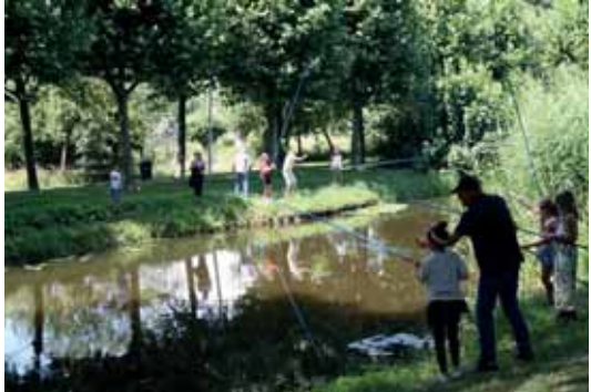
Voor de jeugd is het nu aantrekkelijk water.

In de winter van 2016/2017 zijn plannen gemaakt om een proef met graskarpers te doen. Er werden hekken geplaatst, zodat de graskarpers binnen het gebied blijven. Vorig jaar in oktober is er 50 kg graskarper in het water langs de Ooievaarslaan uitgezet. Dit waren vrij grote vissen. Ik schat ca. 35 stuks. Daarna is er gebaggerd. Het lijkt erop dat de graskarpers hiervan geen last hebben ondervonden. Dit jaar hebben we geen last van overmatige plantengroei gehad.