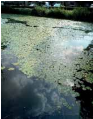
Water bij de van Leijenburgstraat