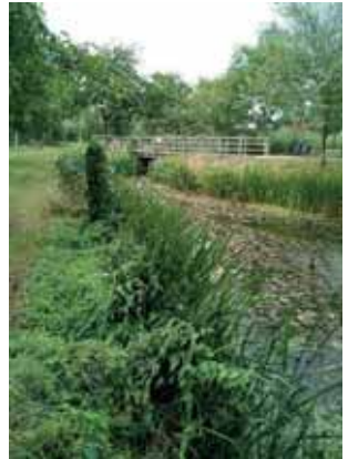
Water bij Loosdorp