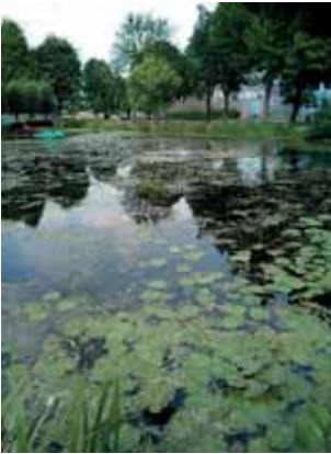
Water bij de Eksterlaan

We hebben veel geluk gehad dat er geen erge hoosbuien zijn geweest. Dan was de kans op massale vissterfte groot geweest.