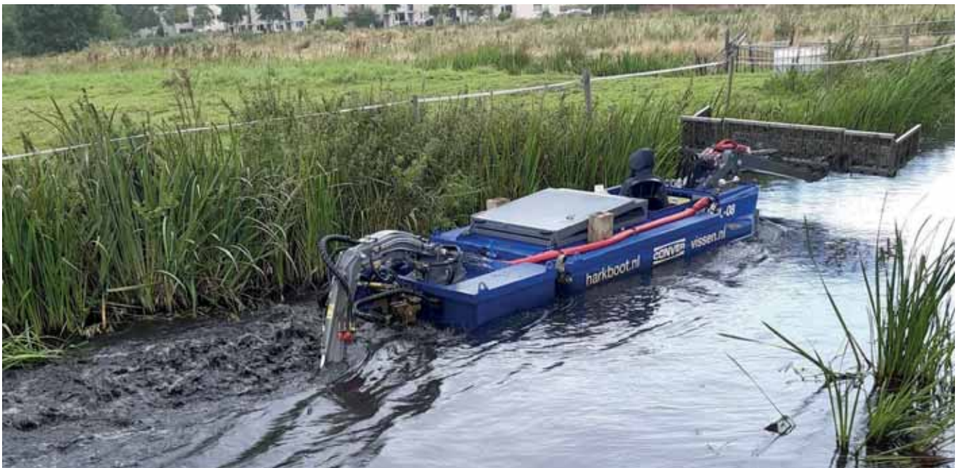
Hier gaat de hark door de baggerlaag en trekt de wortels los.

Wij werden benaderd door een vertegenwoordiger van Harkboot.nl. Zij wilden in deze omgeving een proef uitvoeren om op deze manier de overwoekerende waterplanten te verwijderen. Wij hebben dit water voorgesteld. Dit is een gezamenlijk project wat in overleg tot stand is gekomen tussen de gemeente Vijfheerenlanden en De Snoek. Sportvisserij Nederland ondersteunt dit initiatief financieel en De Snoek volgt de resultaten. Een aantal gemeentemedewerkers op gebied van waterbeheer heeft de uitvoering gevolgd.