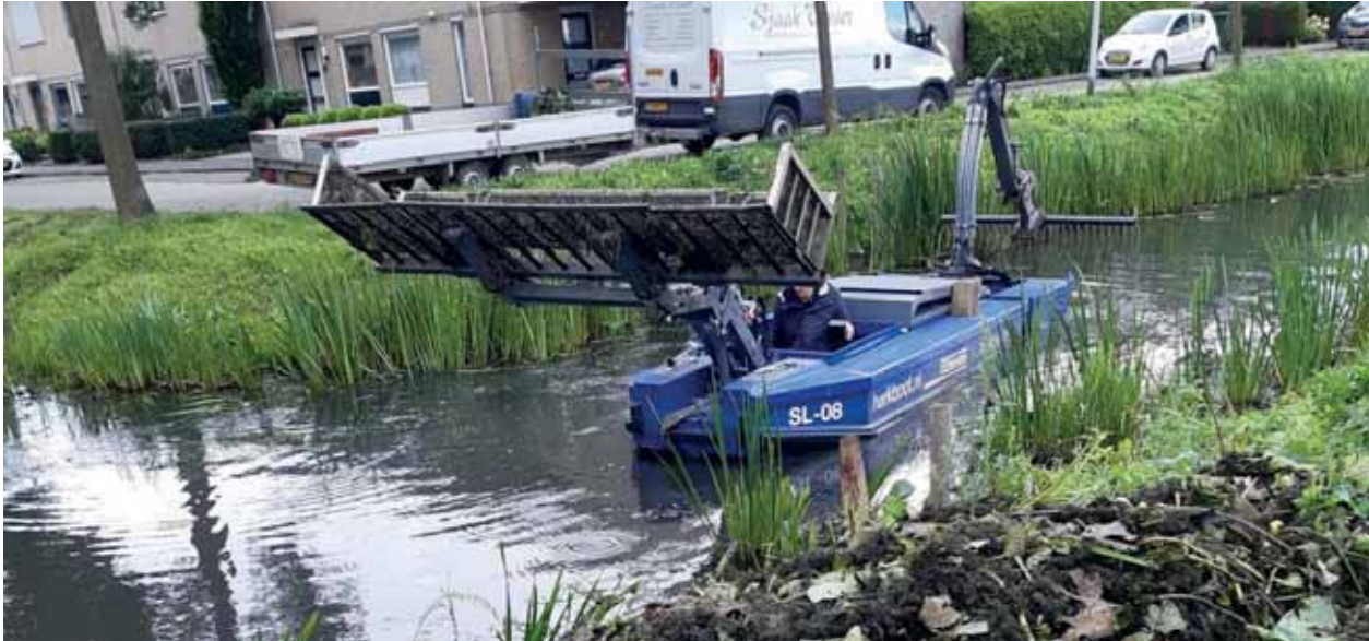
Aan de achterkant zie je de hark

Wij werden benaderd door een vertegenwoordiger van Harkboot.nl. Zij wilden in deze omgeving een proef uitvoeren om op deze manier de overwoekerende waterplanten te verwijderen. Wij hebben dit water voorgesteld. Dit is een gezamenlijk project wat in overleg tot stand is gekomen tussen de gemeente Vijfheerenlanden en De Snoek. Sportvisserij Nederland ondersteunt dit initiatief financieel en De Snoek volgt de resultaten. Een aantal gemeentemedewerkers op gebied van waterbeheer heeft de uitvoering gevolgd.