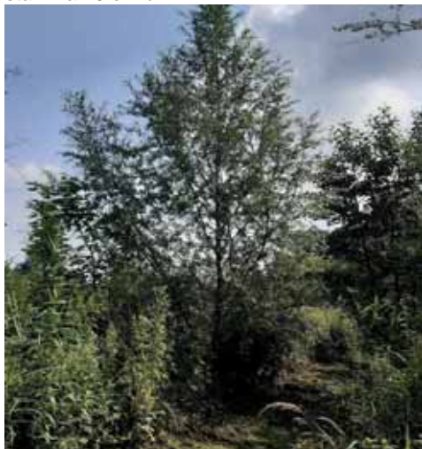
Eén van de wilgebomen

Er zijn twee eiken geplant. Hier leek het er op dat deze het niet gingen doen, maar afgelopen jaar kwamen ze toch op gang. Ze zijn nu 3¼ en 4½ meter hoog en de stammetjes zijn van 1 naar 3¼ cm gegroeid. De groei is pas het afgelopen jaar ingezet en we zijn benieuwd hoe zich dit verder ontwikkelt. Tenslotte is er één populier geplant. Dit werd aanvankelijk afgeraden, want deze gaan maar 30 jaar mee. Deze staat ver van het water en moeten we in 2050 goed in de gaten houden. Deze boom is inmiddels 7½ meter hoog en heeft een stam van 10 cm dik.