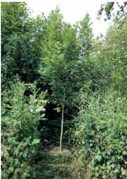
Een prachtige es

Maar de sterkste zeven stuks beginnen het nu goed te doen. Inmiddels zijn ze tussen de 2½ en 5 meter hoog. De stammen zijn van 1½ naar 4 cm dik gegroeid. Er zijn elf wilgen geplant. Hier zijn er drie van gesneuveld. De acht die overgebleven zijn doen het prima. Deze zijn nu tussen de 4½ en 9 meter hoog. De stammetjes hebben nu een dikte van 11 cm. Dit zijn dus al echte bomen. Er zijn negen elzen geplant. Hier zijn er zes van over. Ook deze doen het nu goed. Ze zijn nu tussen de 4 en 8 meter hoog en de stammen zijn ca. 10 cm dik. Van de drie esdoorns zijn er twee over. Deze zijn nu ook goed op gang gekomen en ca. 7½ meter hoog met een stam van 9 cm dik.