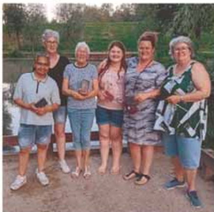
De vissende dames van De Snoek

Woensdagavond, 26 juni is de jaarlijkse viswedstrijd voor de dames gehouden. Deze wedstrijd stond eerst op dinsdagavond, 18 juni gepland, maar er werd toen de hele avond regen voorspeld. Het strijdtoneel was het Wieltje van Collee. De omstandigheden waren zwaar. Er stond weinig wind en de zon scheen volop en zorgde voor een tropische temperatuur. Er werd gevist van zeven uur tot half tien.