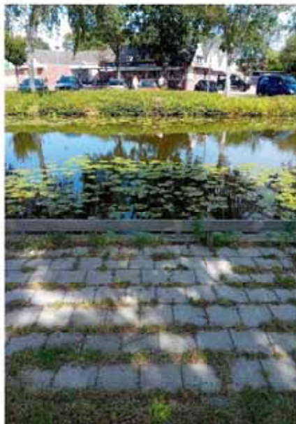
Steiger bij de Eksterlaan

Zo is het plan gemaakt om de harkboot weer op te roepen. Met de harkboot kunnen de wortels los gemaakt worden uit de bodem, zodat deze plant langere tijd weg blijft.