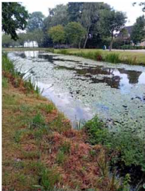
Water bij de van Leijenburgstraat

Bij ons rondje viswater van augustus is een ambtenaar van de gemeente meegegaan en hebben we dit aangekaart. Ook hij was van mening dat hier iets aan gedaan moet worden.