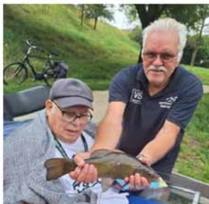
Er werd ook grote vis gevangen