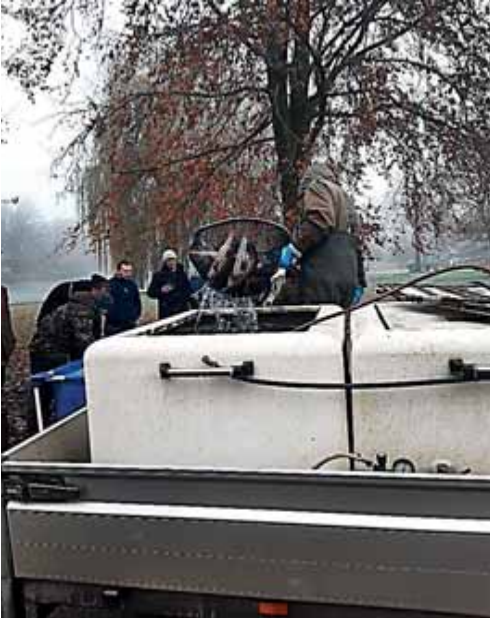
De karpers komen uit ketels.

De vorige keer zijn er tijdens de coronapandemie 150 schubkarpers uitgezet. Deze karpers zien er onderling hetzelfde uit en konden zonder extra bewerkingen uitgezet worden. Dit werd toen gedaan met hulp van enkele vrijwilligers.