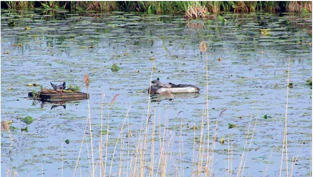
Hier enkele voorbeelden van nesten tussen het plompenblad.

Dit geldt niet alleen voor de zwarte stern maar voor alle vogels.