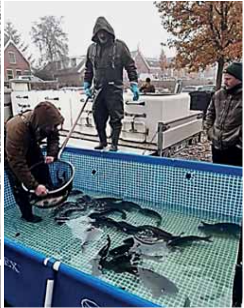
De karpers zijn vanuit de ketels in het zwembad geplaatst

De karpers werden met grote emmers naar de waterkant gedragen en bij het park van Asperen uitgezet. Deze karpers zijn, zoals gezegd, niet van elkaar te onderscheiden. Hooguit door de grootte en het gewicht kun je vermoeden dat ze tot de groep behoren die in 2020 is uitgezet.