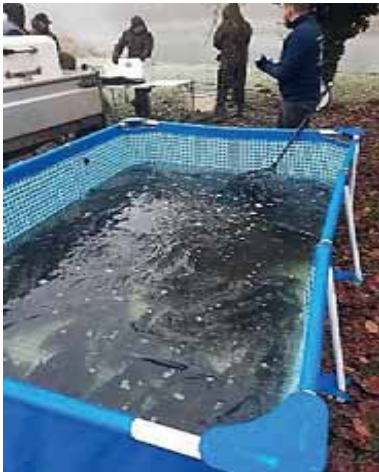
150 karpers in het zwembad.