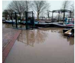
Nog 1 cm. En het water staat op de Zuidwal.