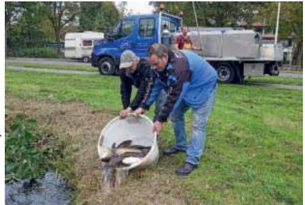
Het uitzetten van de graskarpers

De gemeente heeft overleg gehad met het waterschap maar die voelen hier helemaal niets voor. Het waterschap vindt dat graskarpers niet in ons milieu thuis horen. En ze zijn blij dat de brasemstand laag is. Zij streven immers naar helder water. De plantengroei interesseert het waterschap niet. Zij hoeven dat niet op te ruimen. Dat mag de gemeente doen.