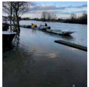
Het doorsnijden van de touwen.