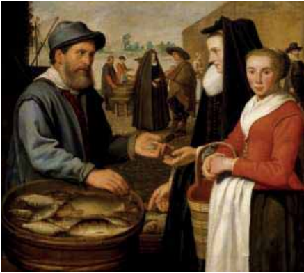
Jacob Gerritsz. Cuyp, De vismarkt , 1627

De komende zomer is er in het Dordrechts Museum van 24 juni tot en met 11 november een bijzondere tentoonstelling, die ook voor sportvissers interessant is. De tentoonstelling Vis in beeld laat zien hoe vis en visserij al eeuwenlang tot de verbeelding spreken en onze kunst en cultuur hebben verrijkt. Met vele (vaak verborgen) betekenissen. Van Jonas in de walvis tot de impotente visser met een slappe hengel. Vis kan een religieuze betekenis hebben of erotische toespelingen bevatten. Het zal voor velen een eyeopener zijn, om te zien hoe rijk en divers dit onderwerp is: van het overdrachtelijk gebruik van vis, visvangst, vissers en visserij in de Nederlandse kunst en cultuur van de late middeleeuwen tot heden.