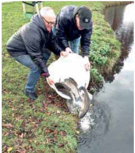
Enkele vrijwilligers in actie.

De vissen kunnen nu door vrijwel geheel Leerdam-Noord zwemmen. Hopelijk zullen de vissen er voor zorgen dat het water niet meer geheel dicht groeit.