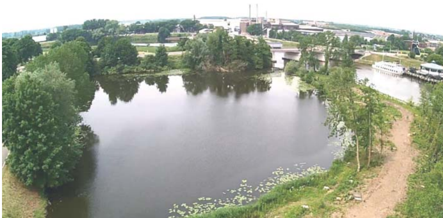
Veerwiel na de kap, voorjaar 2015