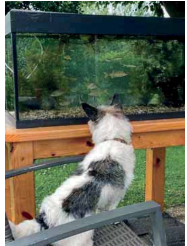
Aquarium trok ieders aandacht.

De spellen waren eendjes vangen, gatenkaas, kipvangen en de bibberspiraal. Vooral de jeugd vond dit geweldig. Hier is de hele dag gebruik van gemaakt. Vooral het kip vangen was erg populair. Maar ook de bibberspiraal trok veel aandacht, terwijl de kleinste bezoekers het eendjes vangen erg waardeerden.