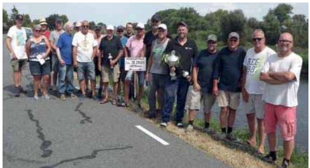
Alle deelnemers aan deze eerste wedstrijd