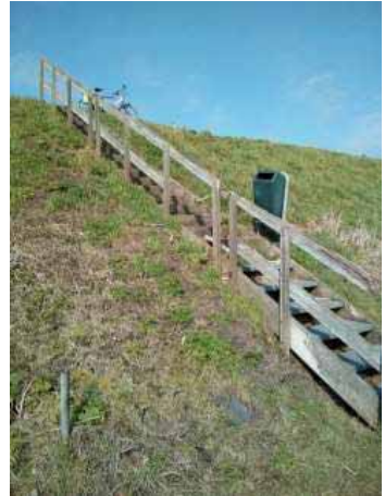
De oude leuning

Begin dit jaar werden wij er op attent gemaakt dat de leuning van de middelste trap van de visplekken langs de steile dijk erg slecht was geworden. Alleen de middelste trap heeft een leuning. Voor de meeste sportvissers is een leuning alleen maar lastig. Je blijft er met de visuitrusting achter hangen. Echter voor sportvissers die slecht ter been zijn is het een uitkomst. Vandaar dat er één trap met een leuning is uitgevoerd. Rondom deze trap zijn zo'n tiental visstekken aanwezig. De trappen zijn ca. in de jaren negentig door de leden van onze vereniging – met subsidie - aangelegd. Er zijn drie trappen. Vooral de derde trap wordt veel door wedstrijdvisser gebruikt.